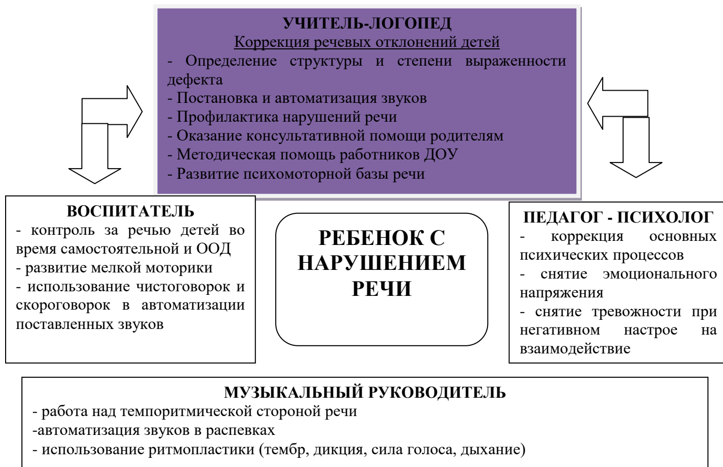
Схема взаимодействия учителя –логопеда с воспитателями и специалистами